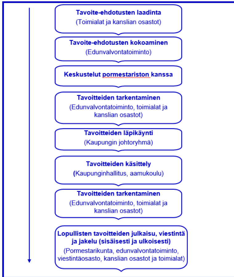
Kuvio 3. Esimerkki kaupungin hallitusohjelmatavoitteiden valmisteluprosessista. 63

Julkinen tarkastuslautakunnan annettua arviointikertomuksen vuodelta 2023 (Julkl 6 § 1 mom. 6 ja 8 kohdat)